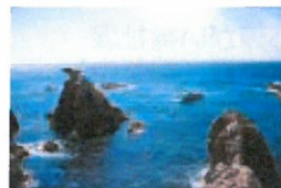
山陰海岸ジオパーク