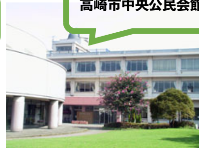
高崎市中央公民会館